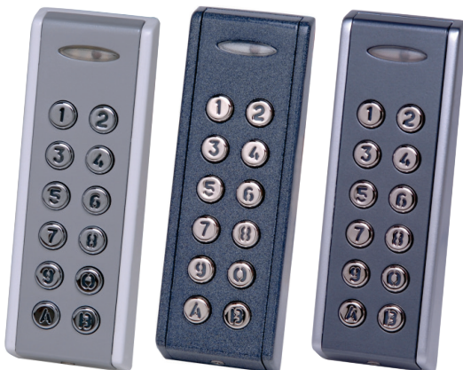
INOX-B (bajo demanda) INOX-G (bajo demanda) INOX-C