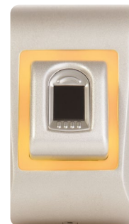
LED orange Mode veille