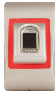
LED rouge Empreinte refusée