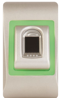
LED verte Empreinte acceptée