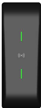
LED Verte Accès autorisé