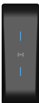
LED Bleue Mode veille