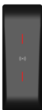
LED Rouge Accès refusé